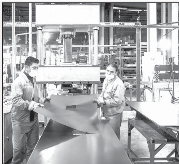
معاون امور صنایع سازمان صنعت، معدن و تجارت استان تهران گفت که آغاز ساعت کار کارخانجات و کارگاه‌های تولیدی در آبان‌ماه هم از ساعت ۶ است.

زمان اجرای این ابلاغیه صرفاً در مهر سال جاری و هدف از آن روان‌سازی و جلوگیری از ترافیک صبحگاهی شهر بود، اما برای یک ماه دیگر تمدید شد. گفتنی است پیش از این ساعت شروع به کار شیفت صبح کارخانجات و کارگاه‌ها هشت صبح بوده است.